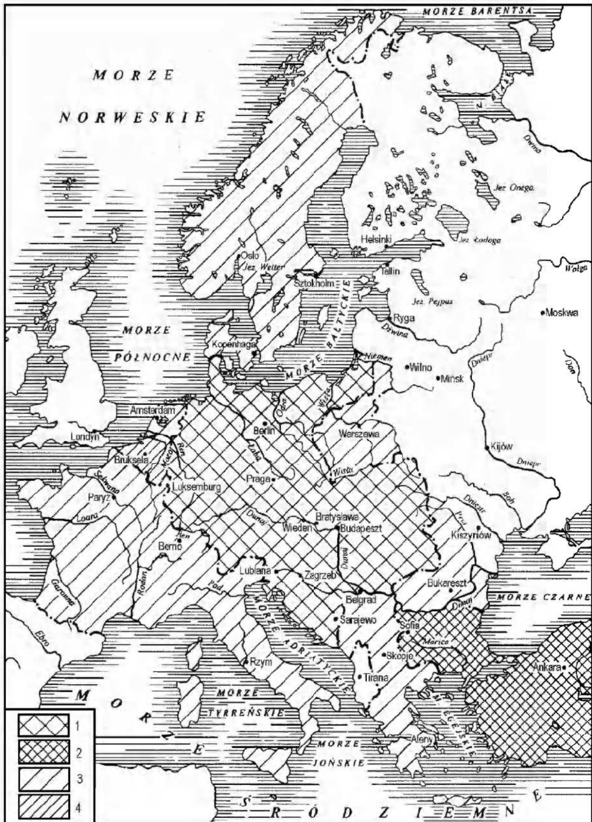
Ryc. 5. Projekcja Mitteleuropy w czasie I wojny światowej według F. Naumanna (1915 r.) 1 – obszar rdzeniowy Mitteleuropy, 2 – Bułgaria i Turcja w 1917 r., 3 – przyszłe państwa w składzie Mitteleuropy, 4 – Belgia

A projection for Mitteleuropa made after F. Naumann during World War One (in 1915) 1 – core area of Mitteleuropa , 2 – Bulgaria and Turkey in 1917, 3 – future states making up Mitteleuropa , 4 – Belgium