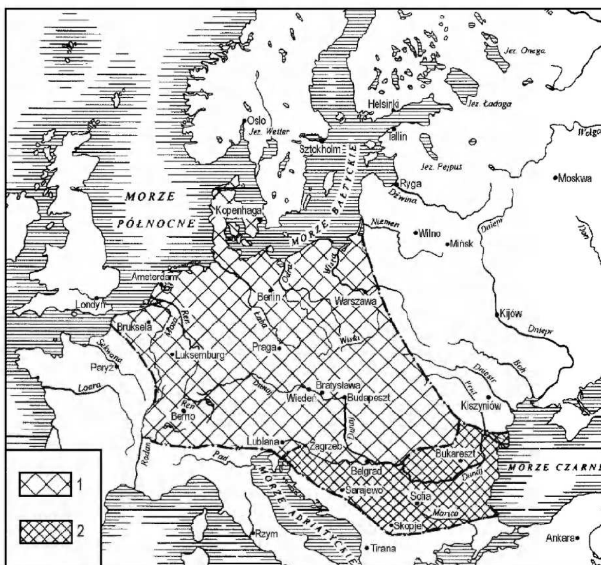
Ryc. 7. Mitteleuropa według H. Hassingera (1917 r.)

Pomimo wojny uniemożliwiającej kontakty między ośrodkami naukowymi niemieckie koncepcje terytorialne zostały dostrzeżone przez badaczy z krajów Ententy. Potraktowano je jako koncepcje imperialistyczne, które nie mogą być podstawą do merytorycznej dyskusji 20 . Bardziej niejednoznaczne było podejście badaczy z terenów opanowanych przez państwa centralne. Na specjalną uwagę zasługuje dzieło J. Szterényi'ego (1861–1941) zajmującego odpowiedzialne