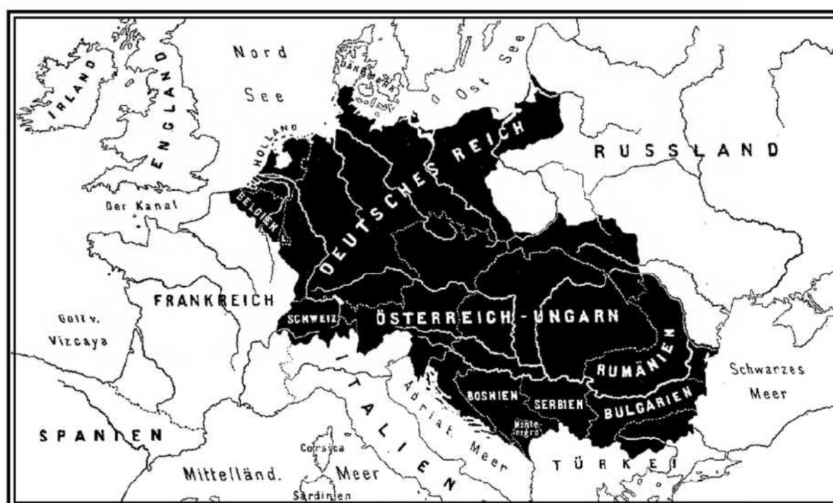
Ryc. 1. Mitteleuropa według J. Partscha

Wykorzystując swoją wiedzę z zakresu geografii fizycznej, dokonał wszechstronnej analizy nie tylko całego tego terytorium, ale i jego zasadniczych części składowych. Pomimo że wydana książka miała rzeczowy charakter naukowy, a autor unikał poruszania kwestii politycznych, wymowa opracowania była jednoznaczna: w centrum Europy znajduje się odrębna kraina geograficzna, odróżniająca się swoją specyfiką fizyczną i kulturową od otoczenia (ryc. 1). Na jej terytorium dominuje naród niemiecki, predestynowany do roli przewodniej. Integracja tego obszaru jest koniecznością dziejową. Sprzyjają jej uwarunkowania geograficzne (klimat, hipsometria, układy hydrograficzne itp.), które działają spajająco i tworzą warunki umożliwiające ukonstytuowanie się wielkiego państwa, które może stać się wiodącym mocarstwem europejskim.