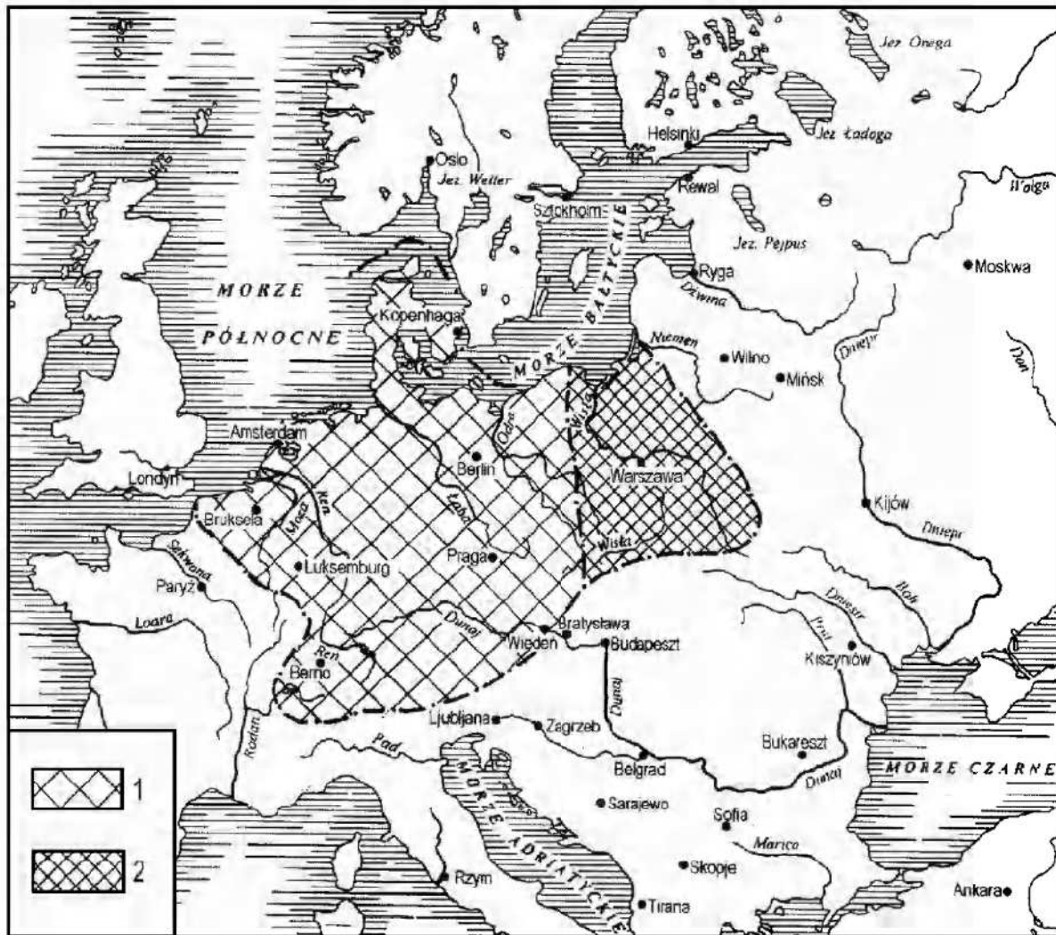
Ryc. 3. Mitteleuropa według A. Hettnera (1907 r): 1 - Mitteleuropa, 2 - Kraj Wisły Mitteleuropa after A. Hettner (1907): 1 - Mitteleuropa, 2 - Land of the Vistula

wschodnia część Francji, zaś na północnym wschodzie cała Białoruś i kraje bałtyckie aż po Zatokę Fińską. W granicach „Wielkich Niemiec” autor umieścił również Wiedeń, Pragę, Bratysławę i Zagrzeb; trudno zrozumieć oddzielenie tych miast od Cesarstwa Habsburgów. Zasięg terytorialny Cesarstwa Austro-Węgierskiego pozbawionego swoich zachodnich prowincji jest też niezmiernie rozległy, gdyż obejmuje całe Bałkany (bez Grecji), Królestwo Polskie oraz Ukrainę, sięgając aż po Morze Azowskie. Wyodrębniona niewielka enklawa przy ujściu Dunaju do Morza Czarnego została włączona do „Wielkich Niemiec” (ryc. 4). W tej całkowicie utopijnej wizji zasięg przestrzenny Mitteleuropy nie jest ograniczony żadnymi względami politycznymi, fizjograficznymi czy prawnymi. W książce pt. Gross Deutschland (1911) zamieścił na okładce mapę z zaznaczonymi obszarami, które powinny znaleźć się pod niemiecką kuratelą. Nie licząc terytoriów europejskich w skład „Wielkich Niemiec” wchodził cały Bliski Wschód, następnie w Ameryce Południowej między innymi: Argentyna, Chile, Paragwaj i Uru-