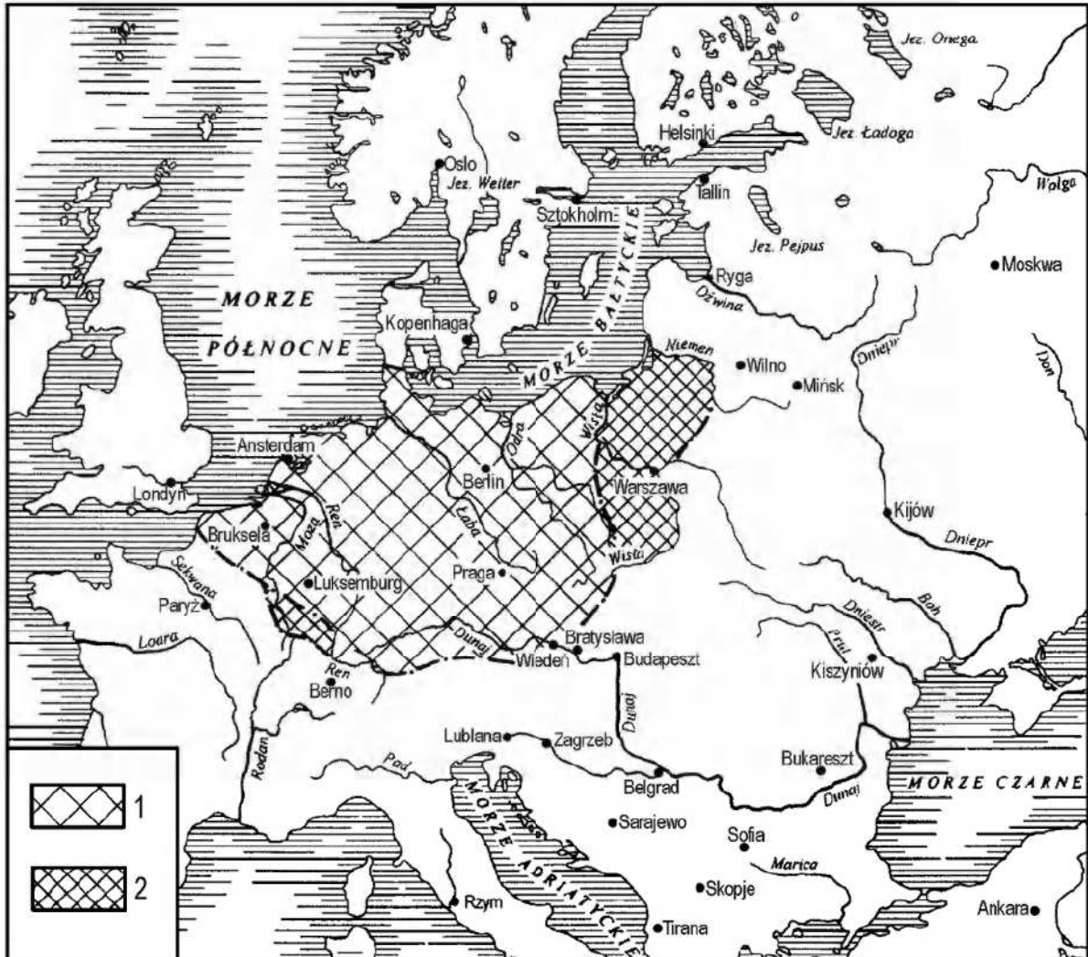
Ryc. 2. „Germańska Mitteleuropa” według H. Wagnera (1883 r.):

torialnej był znacznie obszerniejszy. Na wschodzie dołączono do obszaru będącego pod kuratelą Niemiec całe dorzecze Wisły, na południu Szwajcarię, na północy zaś cały Półwysep Jutlandzki (ryc. 3).